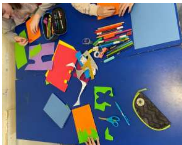
креативност и тимски рад