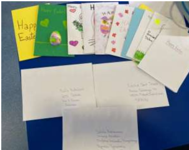
спремно за слање